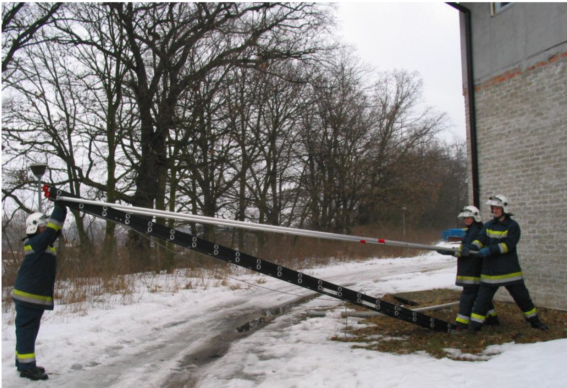
Podnoszenie drabiny do pozycji pionowej.