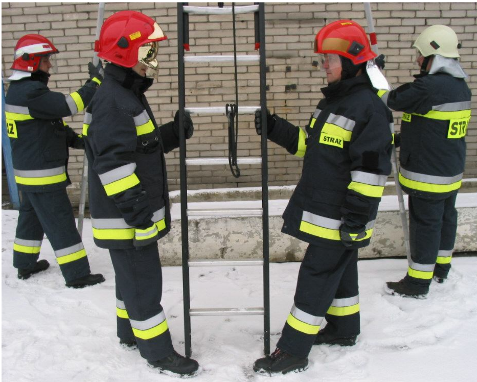
Asekuracja pracujących na drabinie.