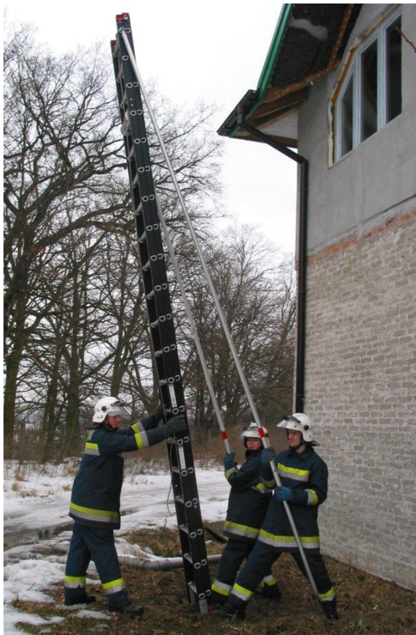
Pozycja przed oparciem drabiny o ścianę