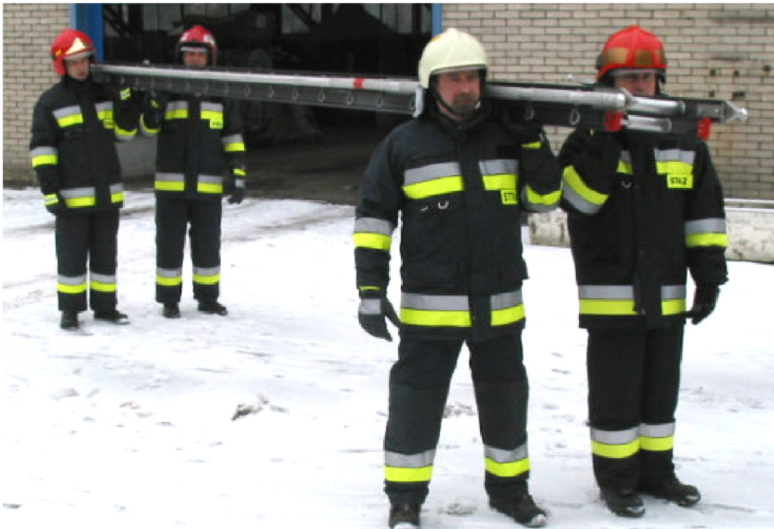
Transport drabiny na miejsce akcji